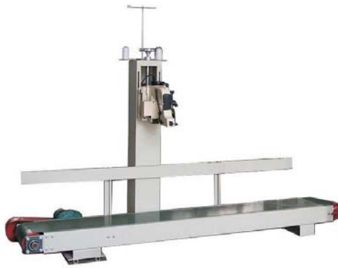
Băng tải, máy may bao