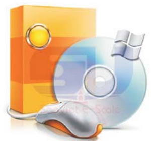
Phần mềm quản lý