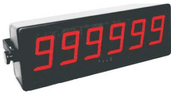
Bộ đếm số bao