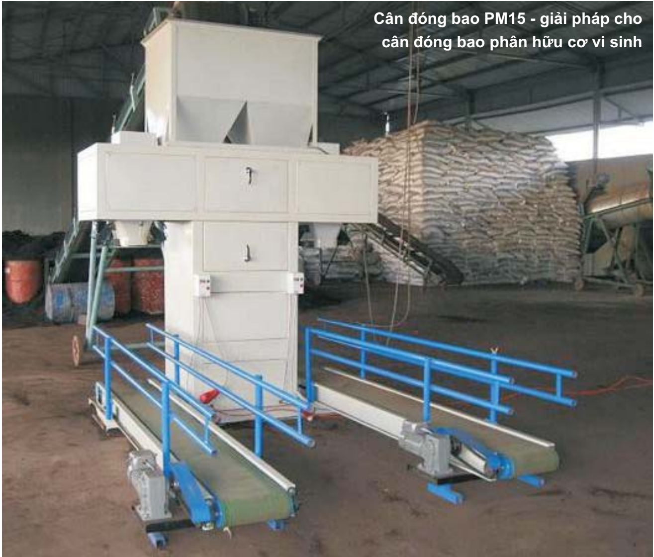
Cân đóng bao PM15 - giải pháp cho cân đóng bao phân hữu cơ vi sinh